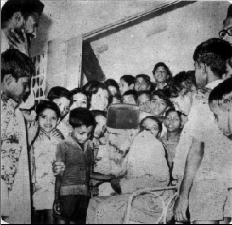
നല്ല ഇടയന്റെ കുഞ്ഞാട്ടിൻപുറം. തലക്കോട് സെന്റ് മേരീസ് ബാലഭവനത്തിലെ കുഞ്ഞുങ്ങളോടൊപ്പം