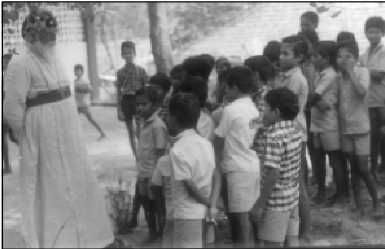
“നല്ല കുഞ്ഞുങ്ങളായി വളരണം.” കുഞ്ഞുങ്ങൾക്ക് തിരുമേനി അപ്പച്ചന്റെ ഉപദേശം.